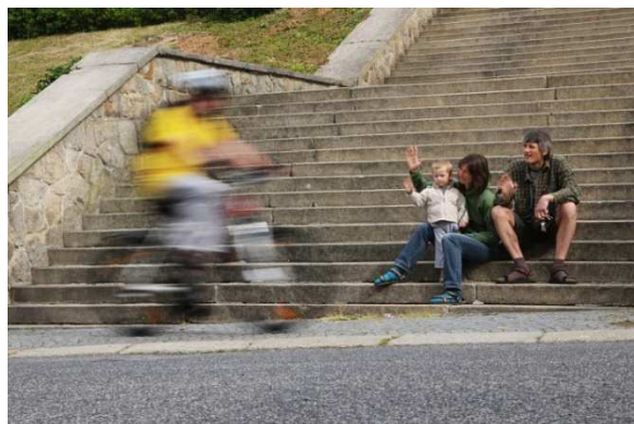
Radek Votoček „Na schodech“ vítězná fotografie

S fotografií “Na schodech” uspěl v několika soutěžích.